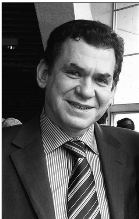
1 Director Ejecutivo de la Corporación Nuevo Arco Iris. Analista político, escritor y columnista de los diarios El Tiempo y El Colombiano.